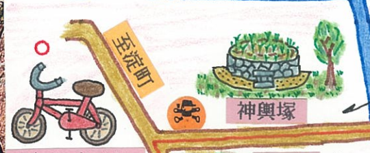
サイクリングターミナル