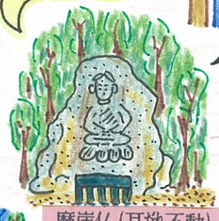
磨崖仏(耳だれ不動)