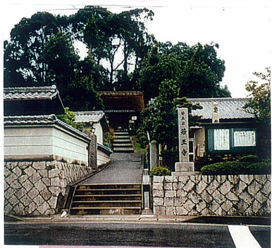
若王寺と佐久奈度御旅所