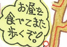
お昼を 食べてまた 歩くぞ!