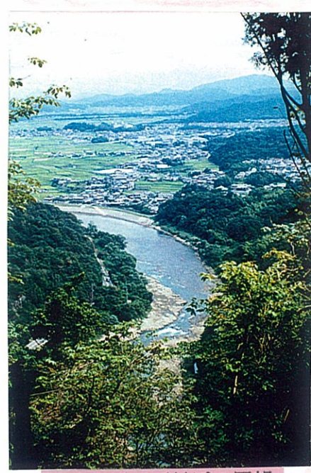
立木参道三丁付近の展望